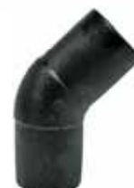
Γωνίες 45° E/A PE 100 Black