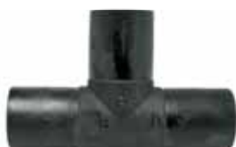
Τάφ E/A PE 100 Black