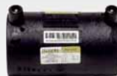
Ηλεκτρομύφες (Μακριές) PE100 Black