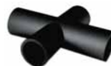
Σταυροί PE 100 Black