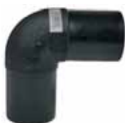
Γωνίες 90° E/A PE 100 Black