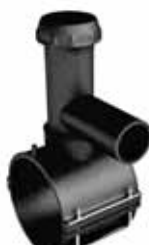
Σέλες Παροχής Κοπτικό PE 100