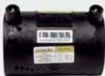
Ηλεκτρομύφες PE100 Black